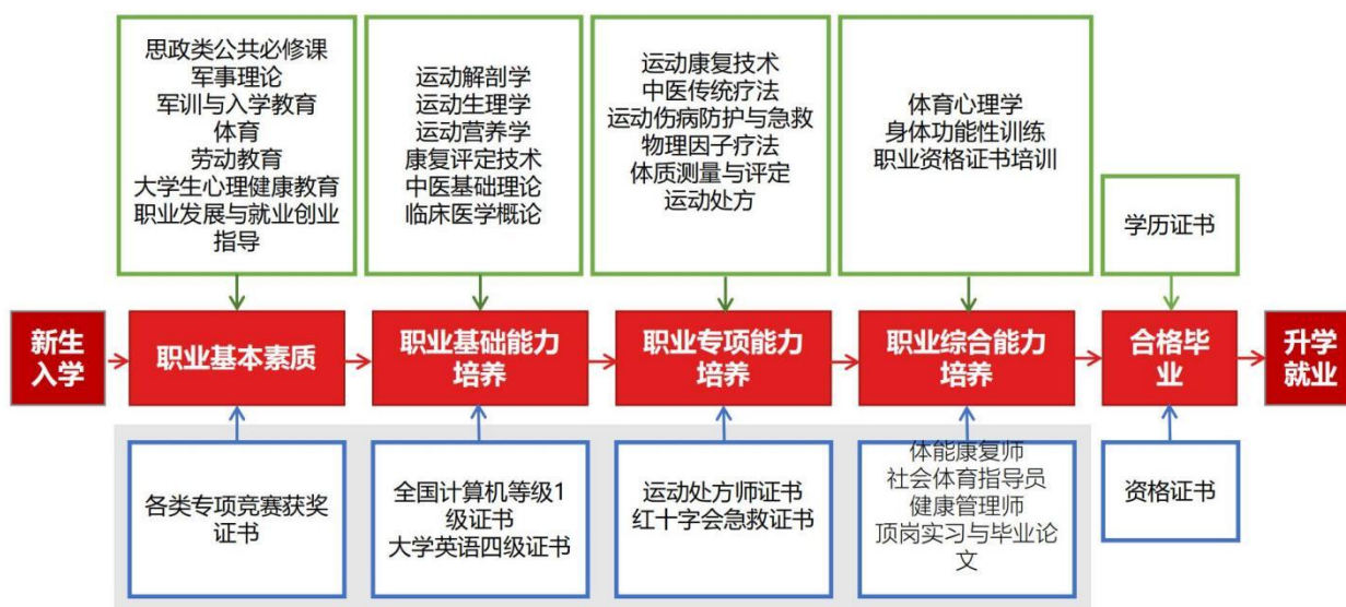
图 2 课程体系与职业能力之间的匹配关系

课程体系的设置服务于专业能力结构的要求，整个课程体系划分为公共课、专业基础课、专业核心课、专业拓展课、毕业实践等五大模块，为学生逐步构建职业基本素质、职业基础能力、职业专项能力和职业综合能力，以适应职业面向与岗位需求。