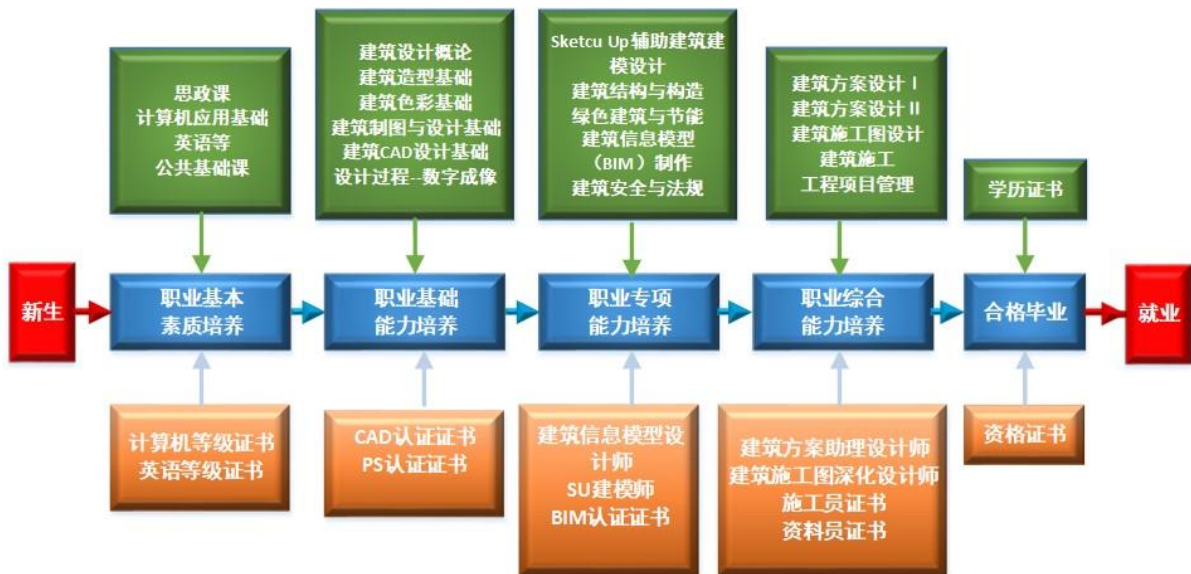
图 2 课程体系与职业能力之间的匹配关系

课程体系的设置服务于专业能力结构的要求，整个课程体系划分为公共课、专业基础课、专业核心课、专业拓展课、毕业实践等五大模块，为学生逐步构建职业基本素质、职业基础能力、职业专项能力和职业综合能力，以适应职业面向与岗位需求。